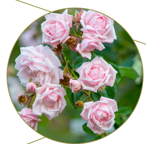
Pergolati con rose