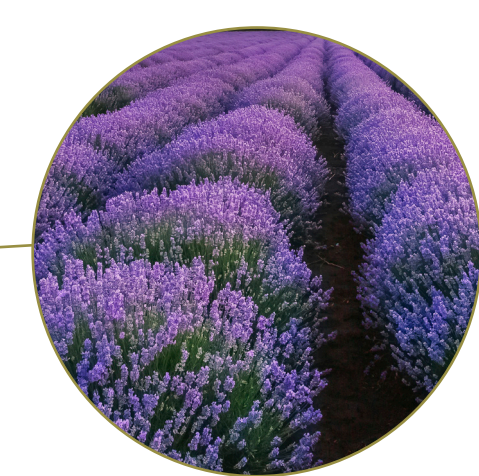
Parterre di lavanda