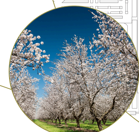
Alberi di mandorlo