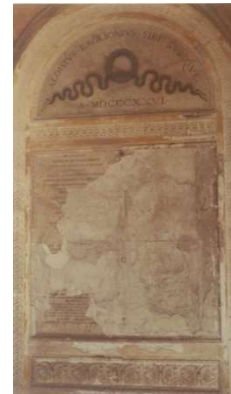
Foto storica - com'era la tomba negli anni '80